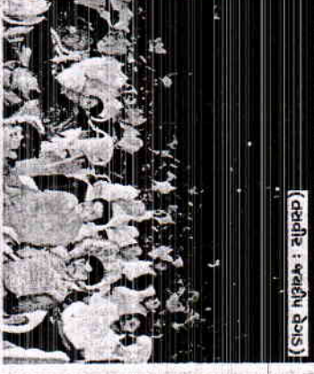
(વહીવટી : જલદીપ ગેસી)

રાજ્ય સરકાર અને ભાવનગરના વહીવટી તંત્ર દ્વારા ખોડીયાર ઉત્સવનું આયોજન કરવામાં આવેલ છે, જેમાં આજે રવિવારે પ્રથમ દિવસે સારામાં ગીતોની રમઝદ જામી હતી. આ ઉપરાંત જુદા જુદા કાર્યક્રમ યોજવા હતાં. ખોડીયાર ઉત્સવમાં શ્રદ્ધાળુઓ બહોળી સંખ્યામાં ઉમટી પડ્યા હતાં.